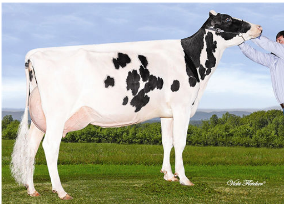
GERANETTE BOLTON LAURE DAM